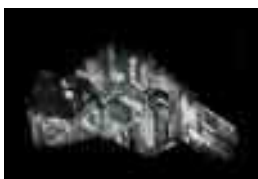
frammento della meteotite di Bagnone

Successivamente fu poi ulteriormente ridotta in molti frammenti distribuiti nei vari musei di storia naturale del mondo, ed il pezzo più pesante dovrebbe oggi essere di poco superiore ai 10 kg.