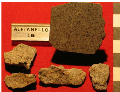
Foto meteorite di Alfianello

Per informazioni e annotazioni scrivere alla UAI-sm gruppo di discussione via e-mail per lo scambio di informazioni e dati osservativi su meteore, bolidi e meteoriti.